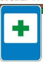
Знак "Пункт первой медицинской помощи"