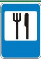
Знак "Пункт питания"